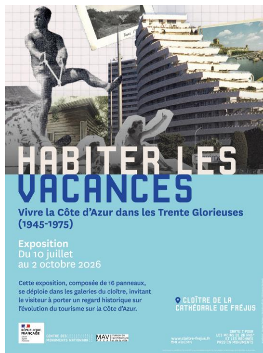
Visuel : © Georges Debanne / © Affiche : Aurore Danneels