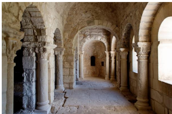
Abbaye de Montmajour