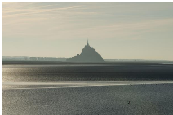
Abbaye du Mont-Saint-Michel