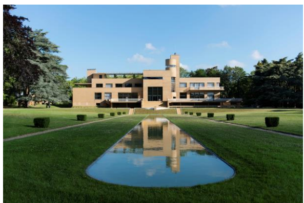
Villa Cavrois