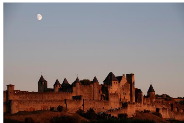
Château et remparts de la cité de Carcassonne