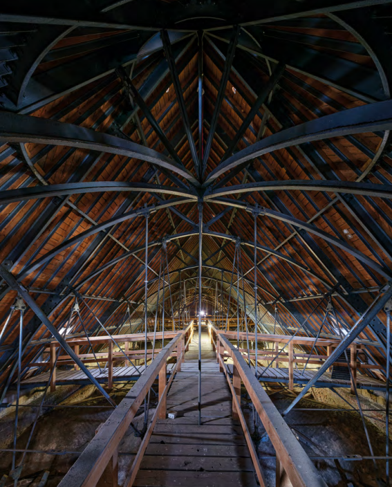
Cathédrale de Cambrai