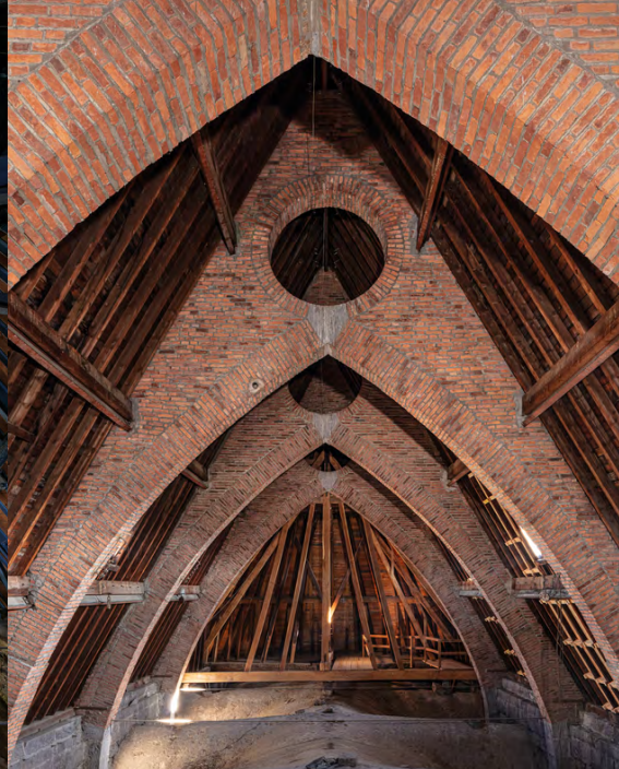
Cathédrale de Clermont-Ferrand