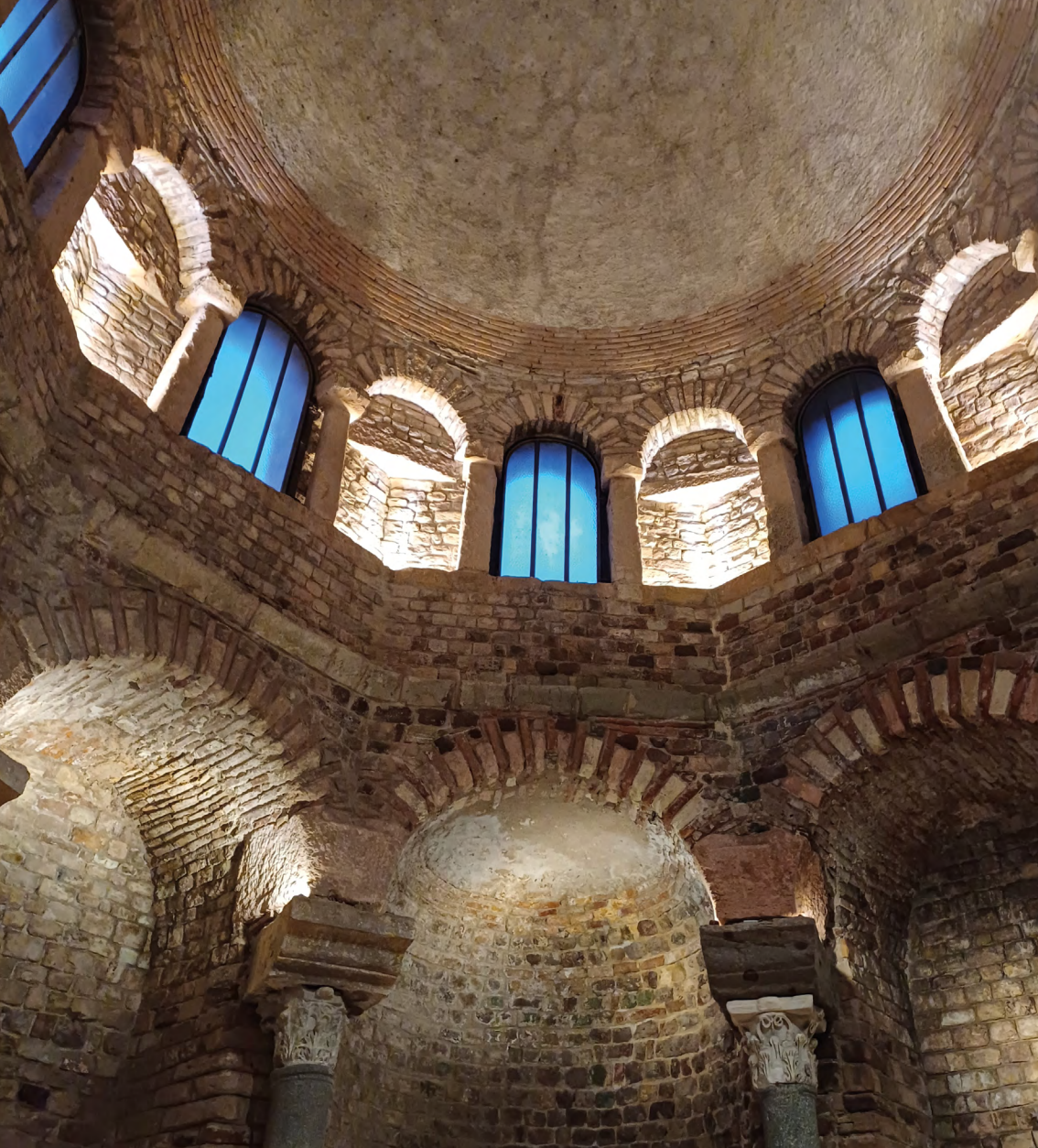
Le baptistère du V ème siècle, ouvert à la visite dans le cadre des visites commentées du cloître

Après la mise en lumière des plafonds peints et de ses espaces fin 2023 (réalisation DRAC - CMN - ACMH Michel Trubert), le cloître va bénéficier d'une autre remise à niveau de son parcours de visite en 2025 avec le renouvellement de la vidéo de médiation permanente sur l'histoire des plafonds peints. Réalisée par la Direction du développement culturel et des publics du CMN, avec la contribution de Georges Puchal, spécialiste de ces décors, cette nouvelle vidéo, opérationnelle à partir du mois de juin, apportera des connaissances actualisées et du confort à nos visiteurs.